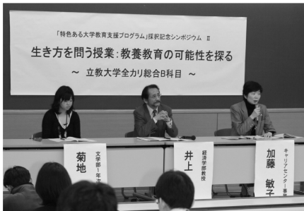
キャリアセンター「仕事と人生」

そして、実際の活動に際しては、企業等には選ばれるのではなく、この私が企業なりを選ぶ。「私が選ぶ」ことが就職活動という活動なのだ。そして、日常的にはhow toという考えではなく、常にWhy、なぜ。なぜそうなんだろう、なぜ、なぜと意識しながら、常に問題意識を持って