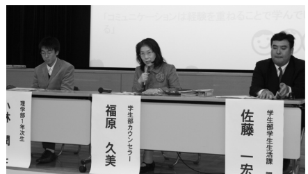
学生部「対人コミュニケーション」

学生の感想を見ていきますと、さまざまな考えがあることを実感したり、コミュニケーションの大切な要素を4日間体験の中から具体的に学んでいることがわかります。それから、自分はコミュニケーションが苦手だと思込んで